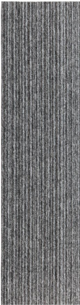
P-AVANT STRIPE 176