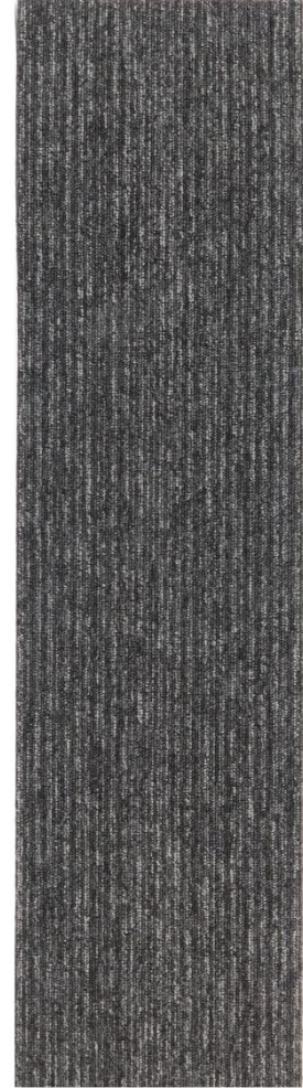
P-AVANT STRIPE 178